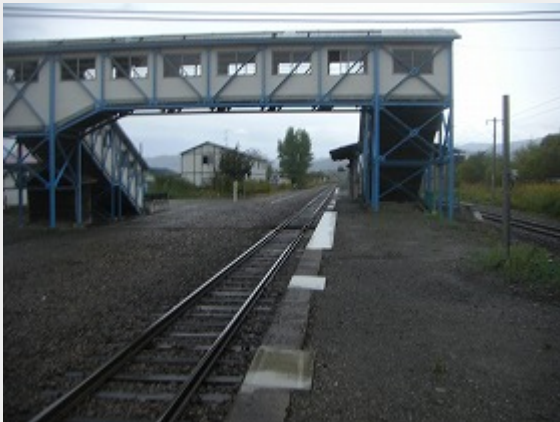
駅の風景（新得方向を望む）