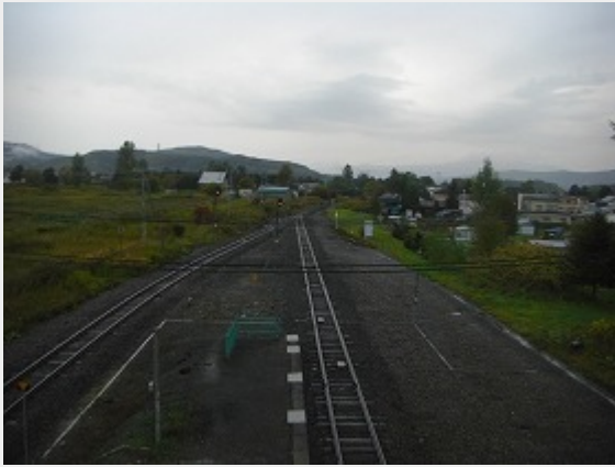
跨線橋から新得方向を望む