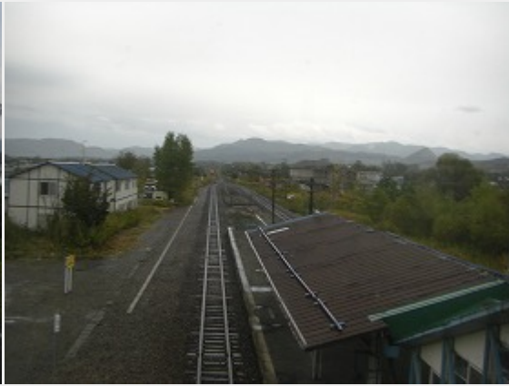
跨線橋から滝川方向を望む