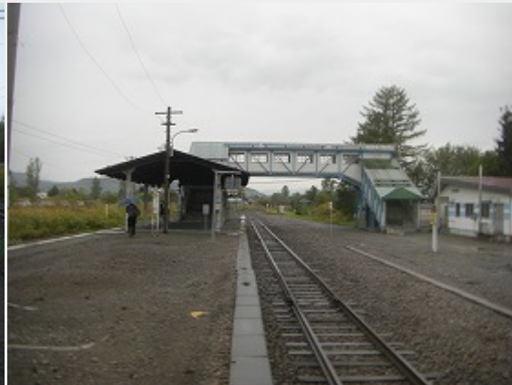
駅の風景（滝川方向を望む）